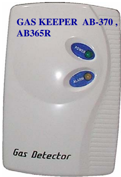
เครื่องเตือนแก๊สรั่ว