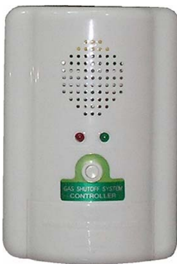
เครื่องควบคุม

ใช้ติดตั้งภายในอาคาร หรือ ห้องครัวบ้านพักอาศัย ติดตั้งง่าย เพียงยึดขาเสียบไว้ที่กำแพง สูงไม่เกินกว่า 30 ซม.